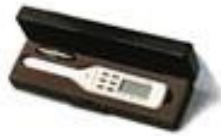
Beschermdoos voor PlanWheel